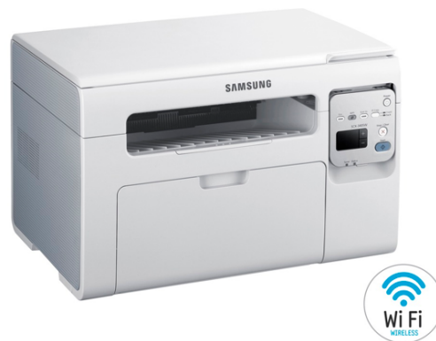
Multifuncional Samsung SCX-3405W

De acordo com as figuras e conhecimentos relacionados a hardware e redes, marque a alternativa correta.